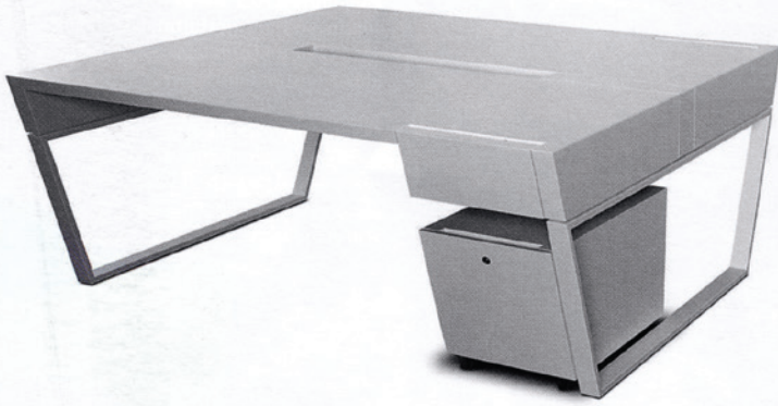
'Air 202' mit Schubfach und Container an einer Seite. HPL oder Lackoberfläche.

'Air 202' with drawer and container on one side. HPL or lacquered surface.